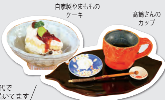
自家製やまものケーキ