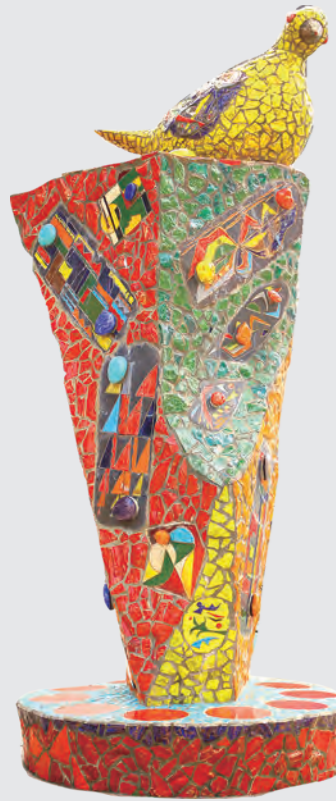
◀ PEACE 高鶴 元さん作

薬院大通駅のバス停前にあるオブジェは自然と人の調和をモチーフにカラフルな色に焼き上げられた陶器で作られています。西方沖地震で倒壊した作品の破片もこのモチーフに使用されており、生きる力と勇気をもらえます！待合のベンチにもなっていますよ。高さは、なんと6m！