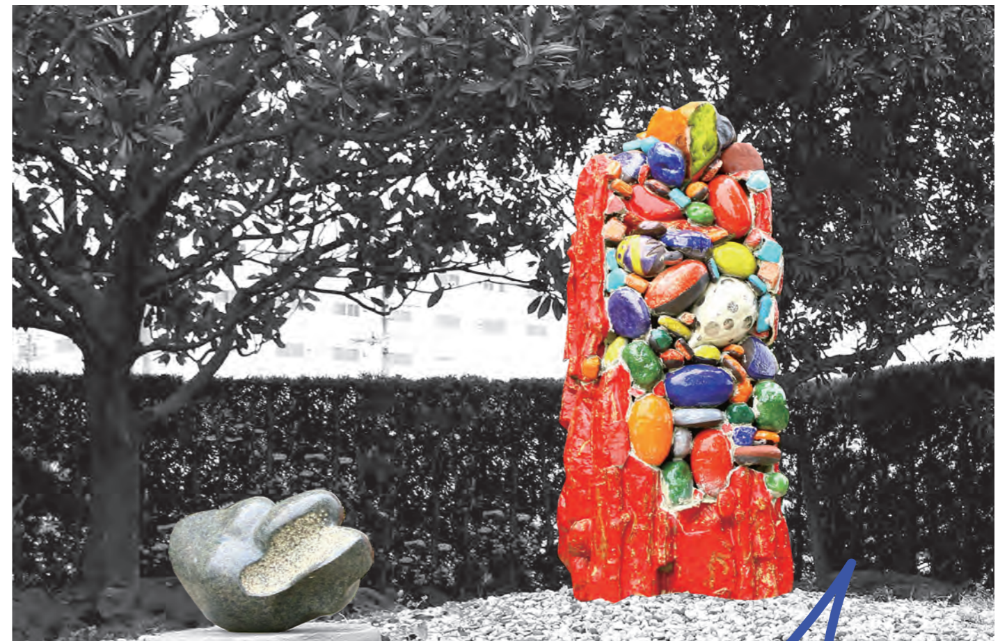
左 / 石彫 / kozuru ataru 右 / オブジェ / kozuru gen